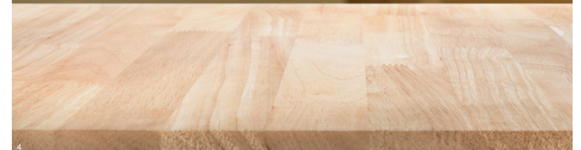
1. Hêtre / 2. Chêne / 3. Hévéa / 4. Plan de travail