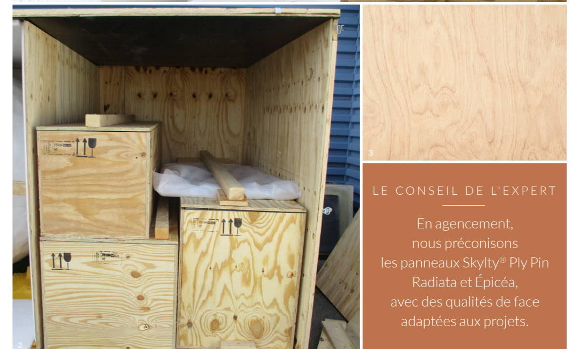
1. Agencement en Pin Radiata / 2. Caisnes d'emballage en Pin Elliotis / 3. Pin Radiata