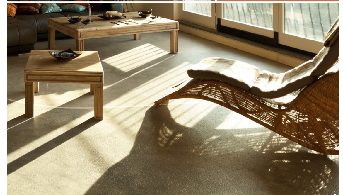
1. Plafond en élégie