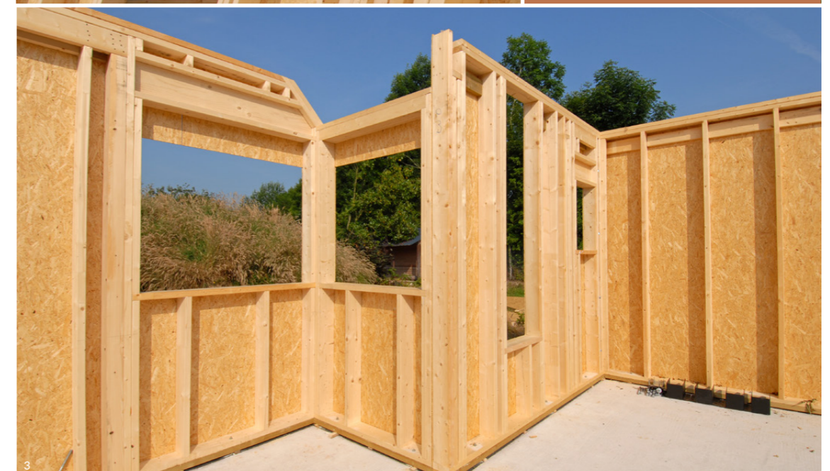
1, 2 et 3. Montants verticaux et lisses horizontales de murs à ossature bois

Solution sèche et légère, l'ossature bois est de plus en plus utilisée en réhabilitation pour réaliser des surélévations d'immeubles ou de maisons.